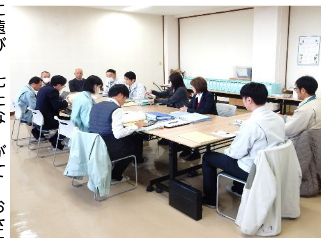
北陸農政局抽出検査の様子

年々、求められる書類が細くなりご苦勞をおかけしますが、事務局としても精一杯サポートさせていただきますので、今後ともよろしくお願い致します。