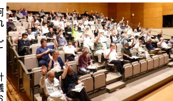
運営委員会通常総会の様子

議件内容としては決算のほか事業計画及び活動計画、予算等について慎重審議され、また、活発な議論、質疑を交わし慎重審議した結果、全議案原案どおり議決されました。