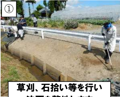
① 草刈、石拾い等を行い 法面を整地します