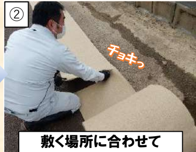
② 敷く場所に合わせて ハサミ等でカットします