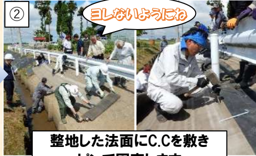
② 整地した法面にC.Cを敷き ピンで固定します