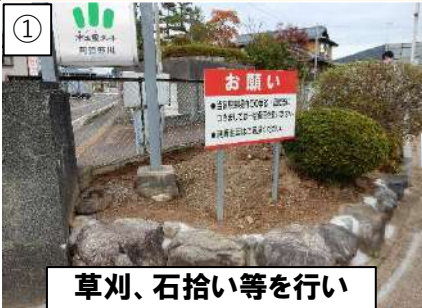
① 草刈、石拾い等を行い 整地します