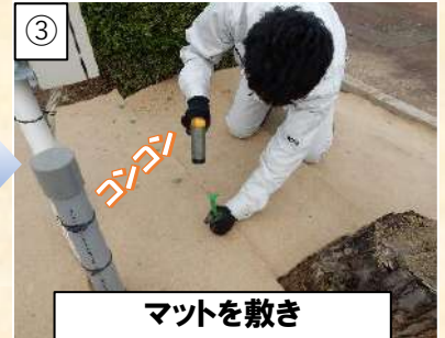
③ マットを敷き エコピンで固定します