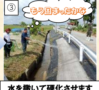
③ 水を撒いて硬化させます