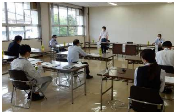
▲書面議決による総会の様子

コロナ禍の中、全組織におかれましては書面議決にご協力いただき深く感謝申し上げます。