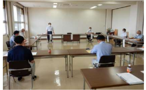
▲書面議決による総会の様子