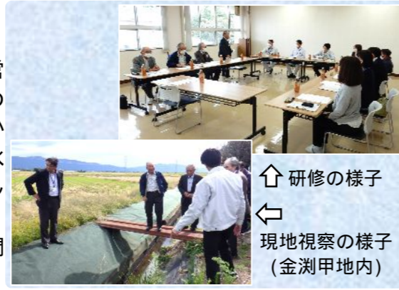
↑ 研修の様子 ← 現地視察の様子 (金淵甲地内)

研修に来られた皆さまは熱心に説明を聞き、たくさん質問されていかれ、有意義な研修となりました。