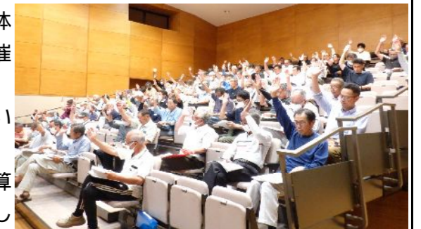
運営委員会通常総会の様子

議件内容としては決算のほか事業計画及び活動計画、予算等について慎重審議され、また、活発な議論、質疑を交し慎重審議した結果、全議案原案どおり議決されました。